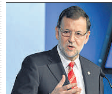
Mariano Rajoy

El presidente del Gobierno, Mariano Rajoy, trasladó ayer al Barcelona a través de un telegrama dirigido al presidente del club, Josep María Bartomeu, su "más cordial felicitación por la conquista de la Liga de baloncesto", un título que muestra "el extraordinario nivel con el que el club juega en todas las disciplinas".